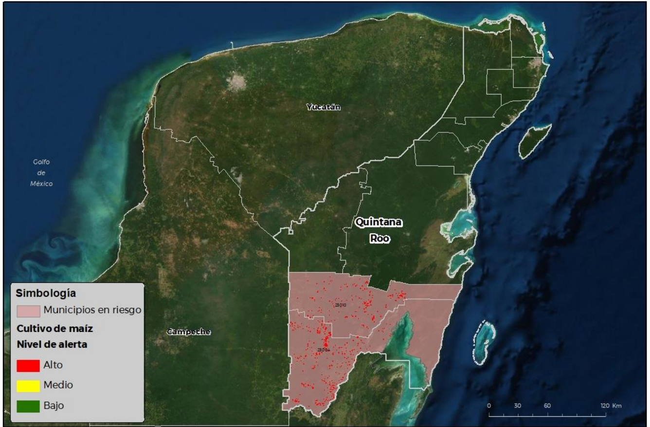
Municipios con cultivo y probable riesgo por Gusano cogollero en Quintana Roo

CEOMATICA-00-SENASICA © 2021 RCO FECHA: 20-01-2022 15:58:20:21